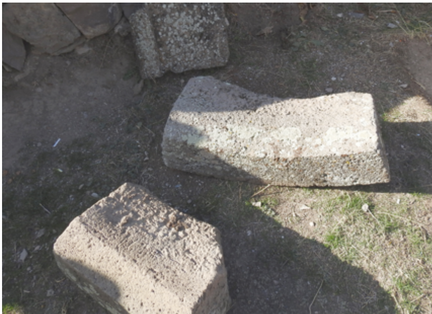
40. Գավթի շքամուտքի բարավորի վրայի կամարի քարեր