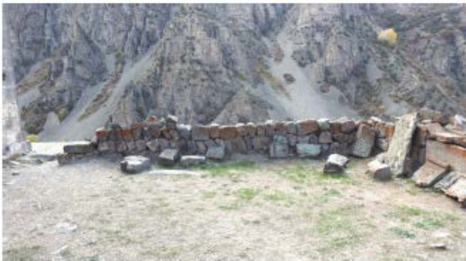
42. Գաղթի հարավային պատի ներքին տեսքը