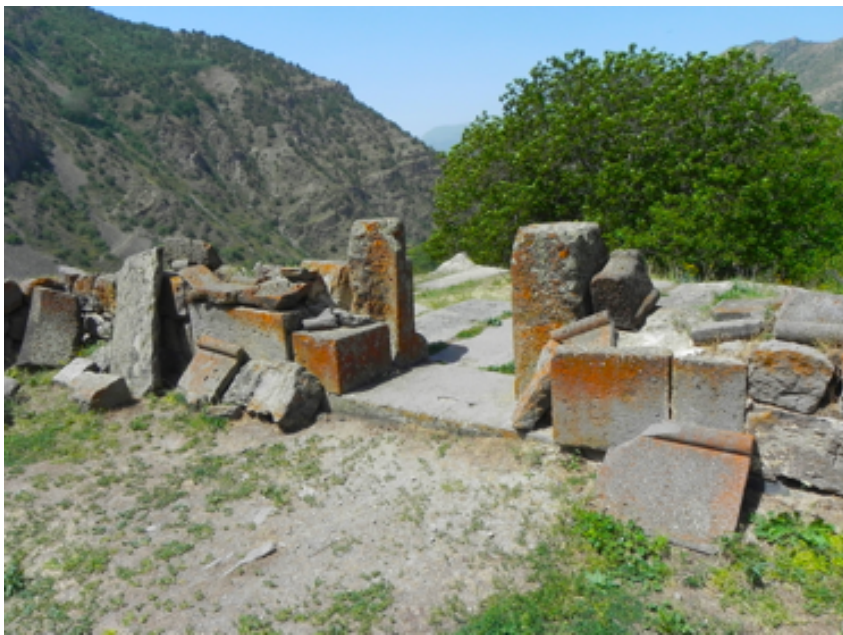
39. Գավթի շքամուտքի ներքին տեսքը