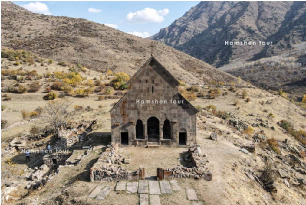
36. Գավթի եւ Եկեղեցու ընդհանուր տեսքը արեւմուտքից

Գտնվում է Եկեղեցու արեւմտյան կողմում: 1046*1058սմ չափերով սեղանաձեւ հատակագծով կառույց է: Շքամուտքը արեւմուտքից է, շարված ծակոտկեն մուգ մոխրագույն տեղական մաքրատաշ բազալտե քարերով եւ կրաշաղախով, իսկ մյուս պատերը՝ անմշակ որձաքարով ու կավահողով: Պահպանված են պատերը մեկ-երկու շարքի չափով: Շքամուտքի մասում օգտագործված է մաքրատաշ քարերով շարվածք: Դժվար է տարբերակել թե այդ անմշակ շարվածքով պատերը նախնական են թե՛ ոչ: Շքամուտքի պահպանաված մեծածավալ եզրաքարերը տրամատված են, փորագրված բազմաթիվ գծային խաչապատկերներով : Գավթի ներսում առկա են վերջինիս արտաքին կամարի եզրային տրամատված քարեր: