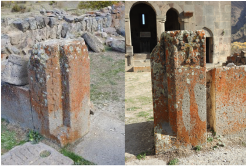
38. Գավթի շքամուտքի արտաքին տեսքը