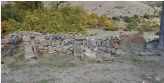
41. Գաղթի հյուսիսային պատի ներքին տեսքը